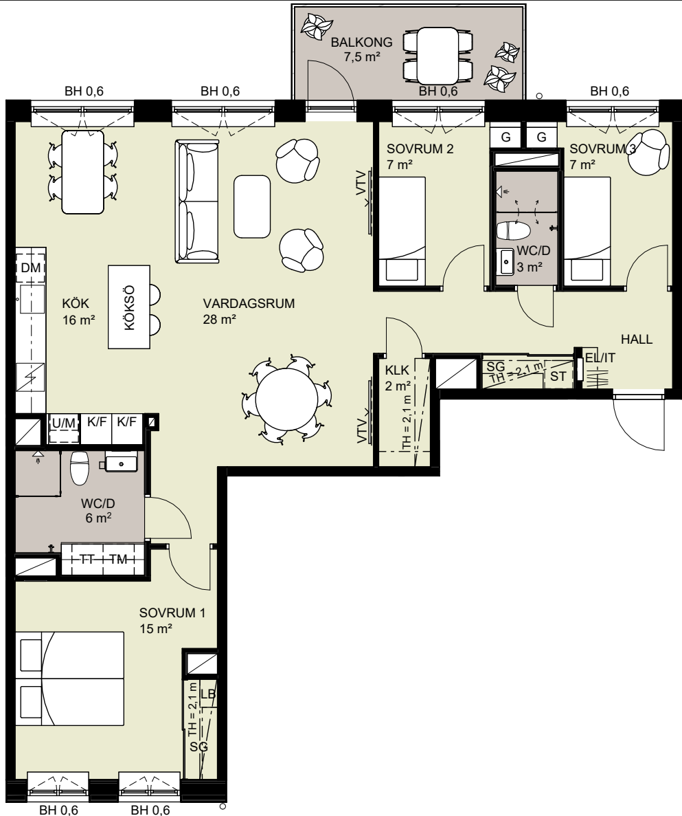
0 1 2 3 4 5m SKALA 1:100